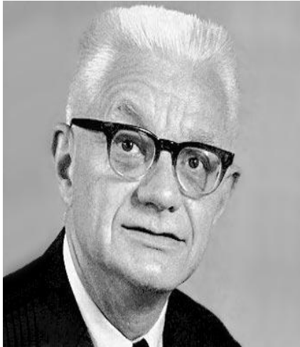
Carl Hempel

Se han rechazado modelos de explicación científica del empirismo lógico. Tanto para las ciencias naturales como para las ciencias sociales. Los modelos de explicación científica que presenta Hempel pretende satisfacer ciertas condiciones o requisitos básicos que deben cumplir las explicaciones para ser consideradas científica.